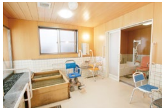
浴室 ひのきのお風呂でリラックスできます。 介護浴室も完備。