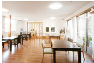
食堂 陽光降り注ぐ開放的なスペースで、 会話が弾みます。