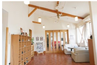
玄関ホール 木の温もりが優しい 広々とした玄関でお迎えします。