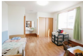
各個室 ナースコール付き個室で、 安心して過ごさいただけます。